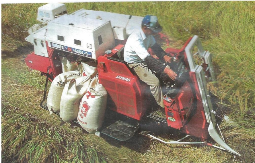
La mécanisation : motoculteur miniaturisé au Japon.